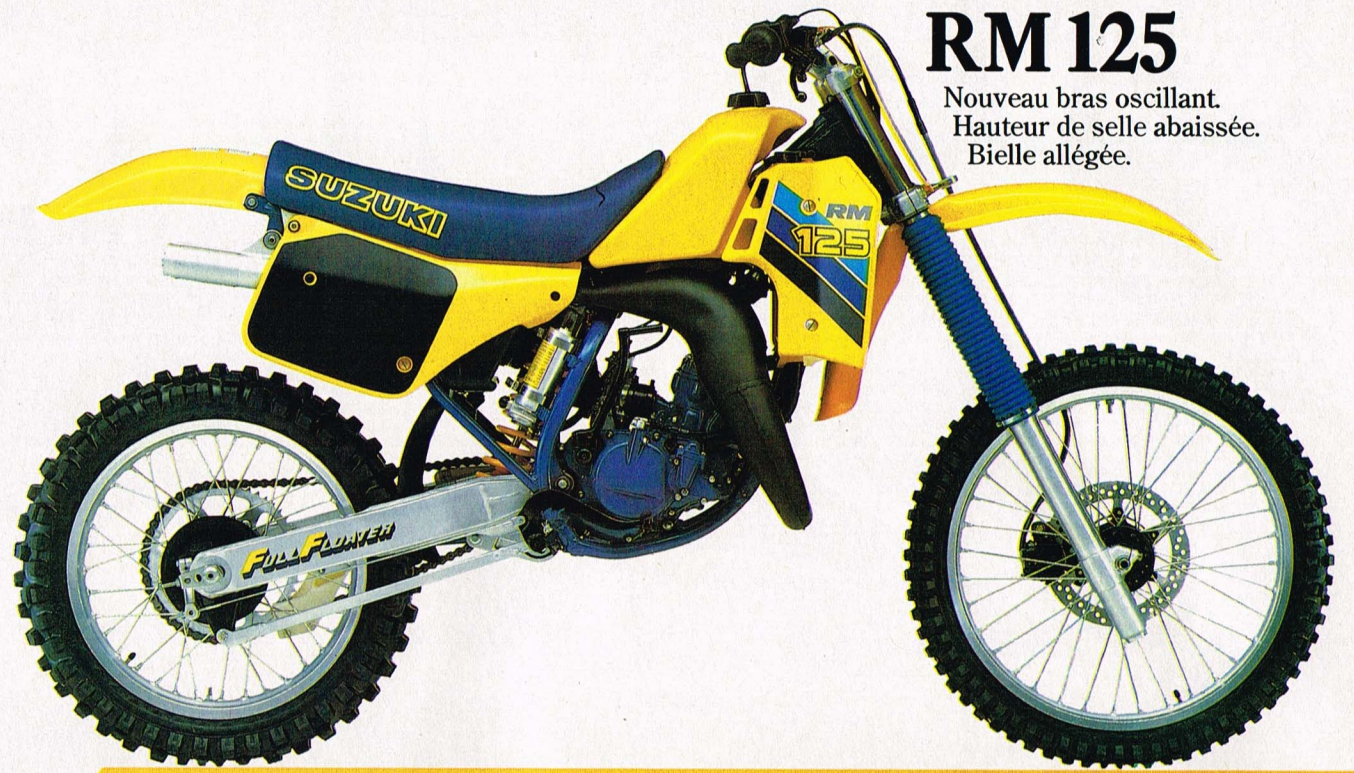
RM 125 Nouveau bras oscillant. Hauteur de selle abaissée. Bielle allégée.