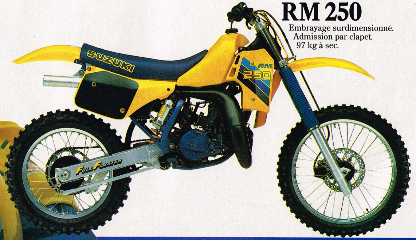
RM 250 Embrayage surdimensionné. Admission par clapet. 97 kg à sec.