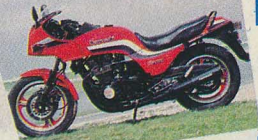
1 er prix moto : XZ 1100 Kawasaki. 2 e prix moto : XZ 750 Kawasaki.