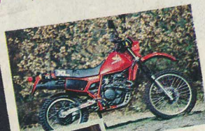
1 er prix TT : XL 600 R Honda.