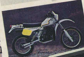
2 e prix TT : 250 WR Husqvarna.