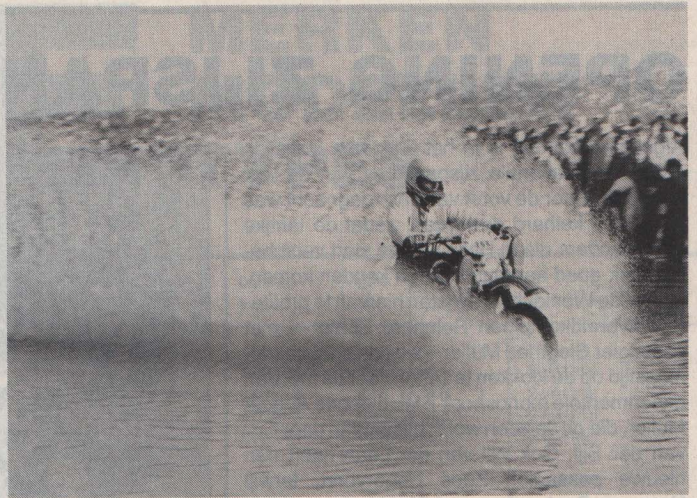
Eén van de talrijke amateurs, die op eigen wijze voor sfeer zorgt.