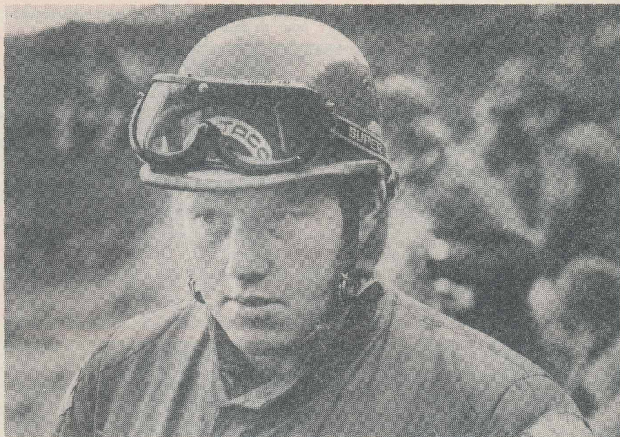
Lampkin est à présent à un tout petit point derrière Rathmell au classement provisoire du championnat.

Après cette manche américaine du championnat du monde, on constate que Rathmell perd de plus en plus de terrain. Vesterinen quant à lui attend avec impatience les épreuves nordiques ! Enfin, Bernie Schreiber a pratiquement perdu toute chance de remporter le titre cette année. En plus, il s'est arraché un ongle en chutant dans une zone. Avant l'épreuve canadienne qui va se dérouler ce dimanche, voici donc les positions provisoires du championnat : 1. Rathmell, 59 pts; 2. Lampkin, 58 pts; 3. Vesterinen, 55 pts; 4. Karlsson, 52 pts; 5. Scheiber et Coutard, 36 pts; 7. Shepherd, 26 pts; 8. Soler, 23 pts; 9. Reynolds, 20 pts; 10. Birkett, 19 pts; 11. Lejeune, 15 pts; 12. Whaley, 12 pts; 13. Edwards, Thorpe et Griffith, 10 pts; 16. Eggar, 6 pts; Don Swett, 5 pts; 18. Leavitt, 4 pts; 19. Andrews, 3 pts; 20. Colson et Evertsson, 2 pts; 22. Lampkin A., 1 pt.