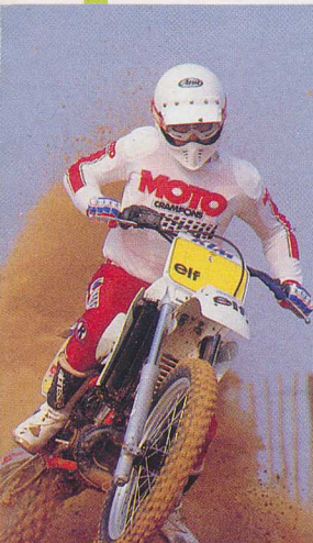
La 500 KTM cross

Couverture : Holeshoot de Bailey au supercross de Daytona