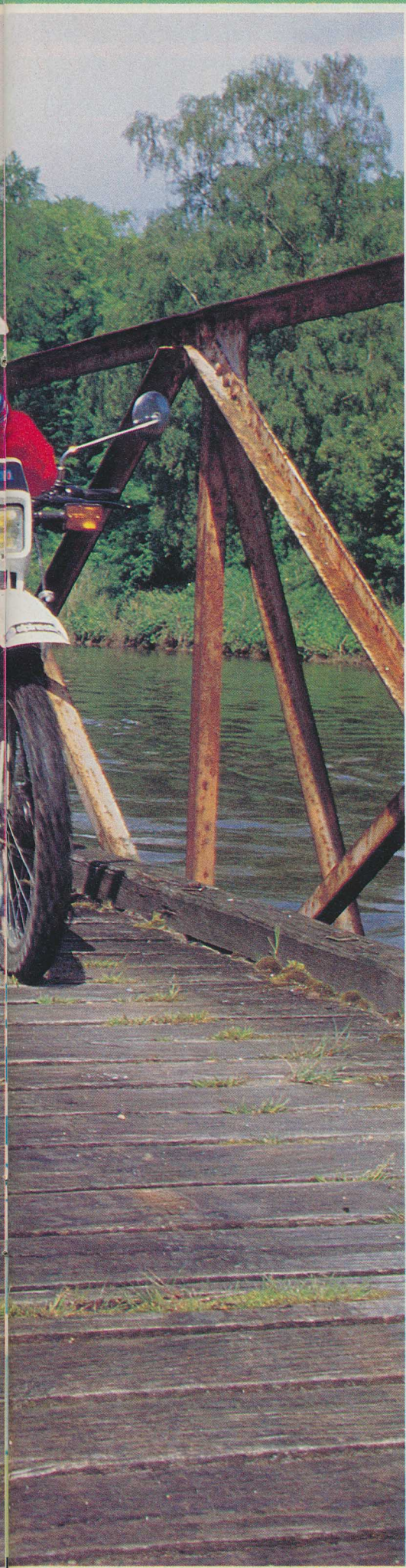
Sur le pont de la rivière « SOMME ».

désormais la référence en matière d'amortissement.