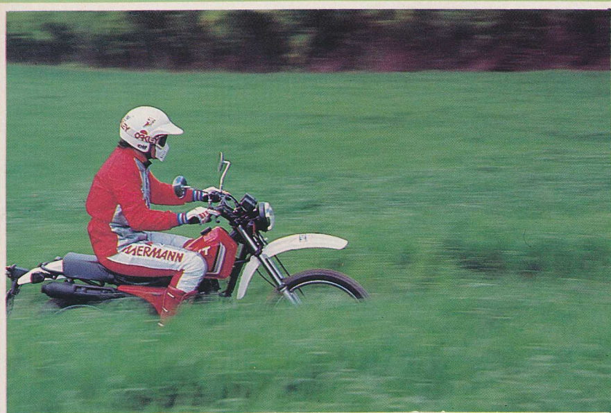
Une XT au caractère bien paisible.