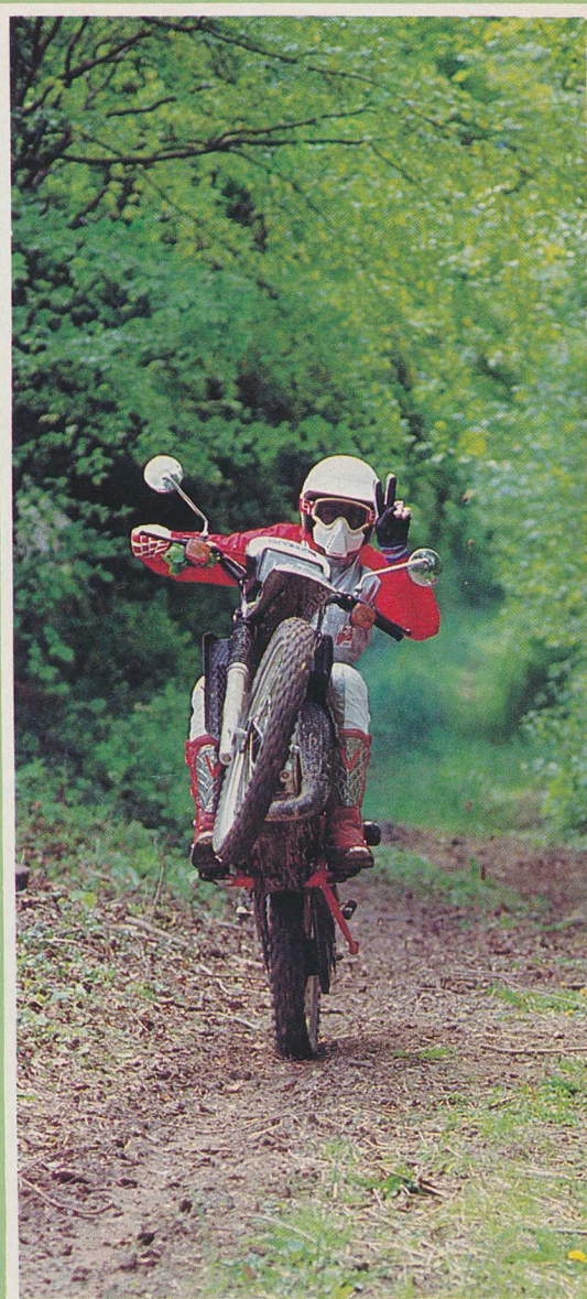
Meilleure 125 Trail du moment, la MTX vous salue.