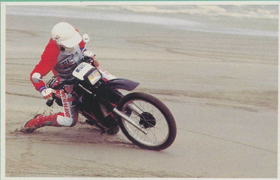
Assez courte d'empattement, la MTX décroche brutalement.

Rien de tel que la sortie de Paris pour tester les qualités purement routières des cinq challengers. Et malgré la molesse des 4 temps en rodage, rouler dans la circulation dense n'est pas véritablement un calvaire (ni un régal d'ailleurs). Autant prendre son mal en patience et de toute façon c'est limité à 60 km/h (sic). D'entrée de jeu, la MTX et la DTLC prennent le large à chaque démarrage, talonnée par la XLR qui se démarque déjà des deux autres 4 temps. La petite XT rame par contre comme ce n'est pas permis. Quant à la Suzuki, elle tente de sauver